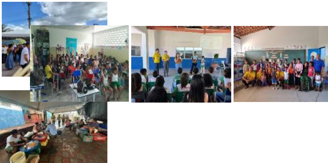
PANFLETAGEM NO ENTREPOSTO DE PESCA – CAMPANHA “MAIO LARANJA”