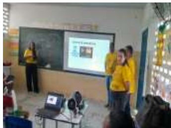
DIVULGAÇÃO NAS ESCOLAS SOBRE “MAIO LARANJA”