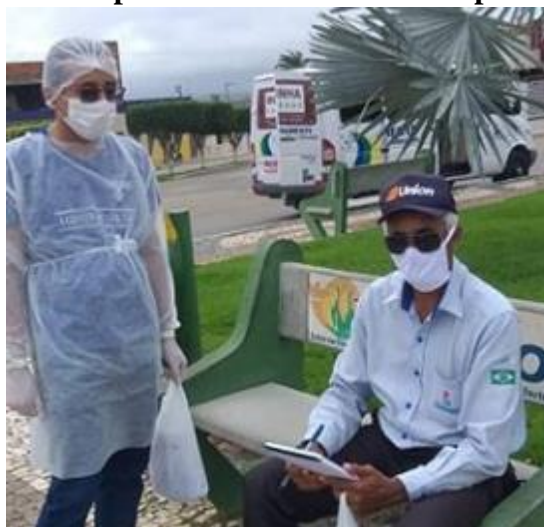
Imagem 11: Equipe de Saúde da família realizando a entrega de Kits para os motoristas das topic.