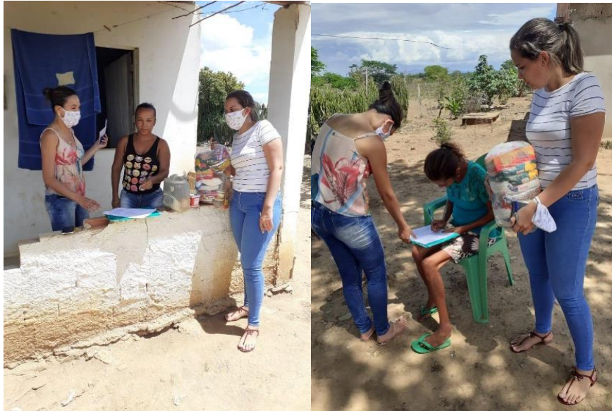
Imagem 12: Entrega de cestas básicas