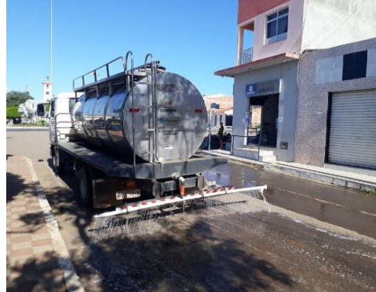
Imagem 1,2 Desinfecção de vias pública com de maior fluxo de pessoas