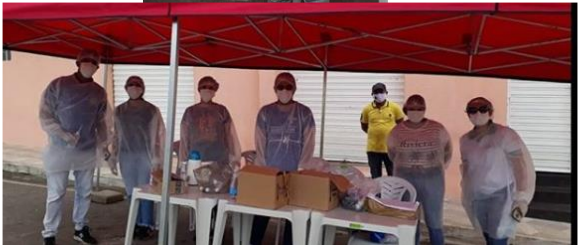
Imagem 12: Equipe de saúde da família e equipe do Nasf realizando orientações à população através da implantação de uma tenda na praça local.