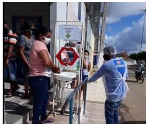
Imagem 6: Equipes realizando orientações na feira livre e na casa lotérica sobre a importância da higienização das mãos