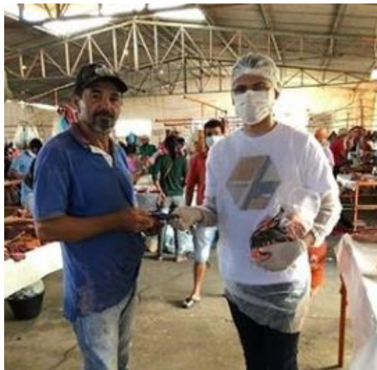
Imagem 10: Equipe de Saúde da família realizando a entrega de máscaras faciais na feira livre