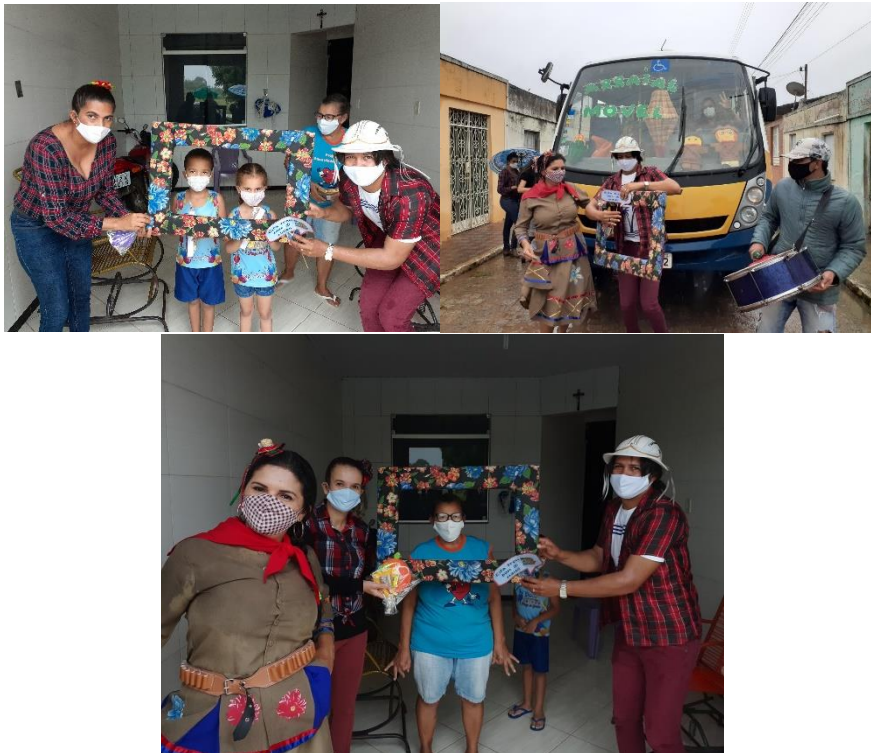
Imagem 13: Ação Arraia móvel realizando visitas nas casas dos usuários