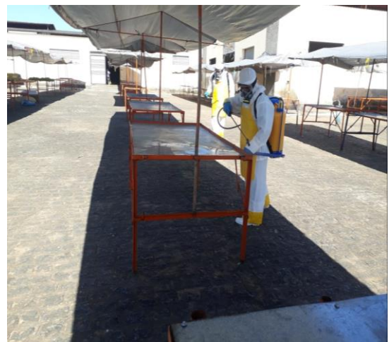
Imagem 3,4 Desinfecção de praças e feira livre para evitar a propagação do covid-19