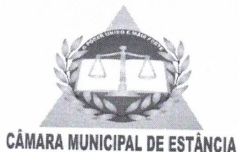
TABELA DE VENCIMENTOS CARGOS EFETIVOS