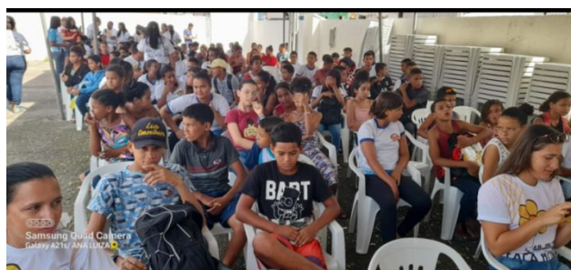
ESCOLA MUNICIPAL JOSE MOACIR MENDONÇA- ALUNOS