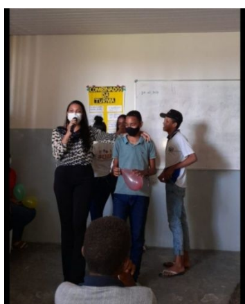
SEDE DE BREJO GRANDE-E.M. J.M.M